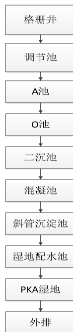
图2-1 小山干工业区污水处理站处理工艺

(1)污水通过管道收集通过格栅井去除大块漂浮物,进入调节池,调节池对水量和水质起调节作用,保证后续污水处理实施进水水量、水质稳定,调节池池水通过提升泵提升到A池。