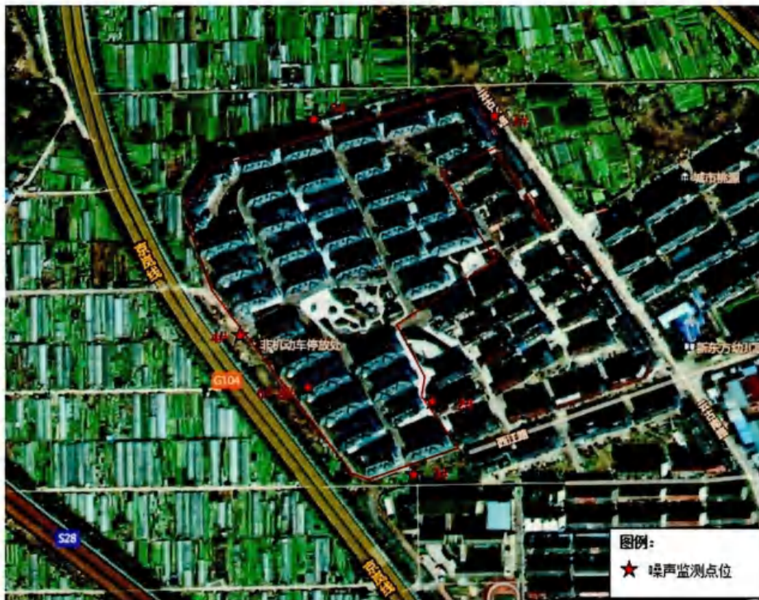
噪声监测点位示意图: (★为噪声监测点, 离地面高度 1.2m)