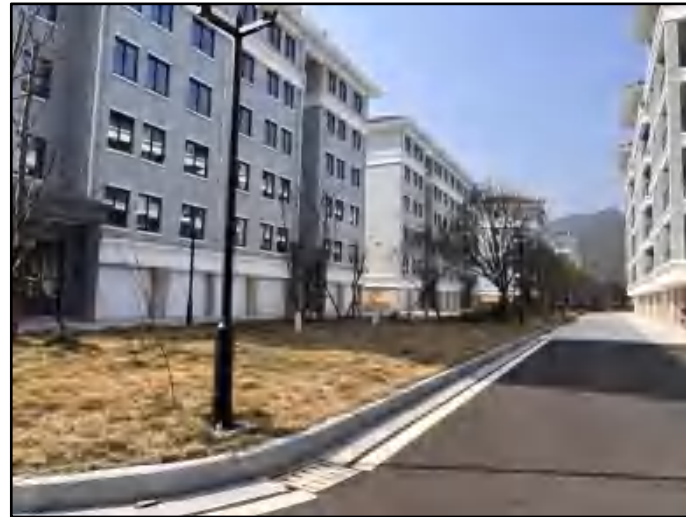
小区绿化及一层车库