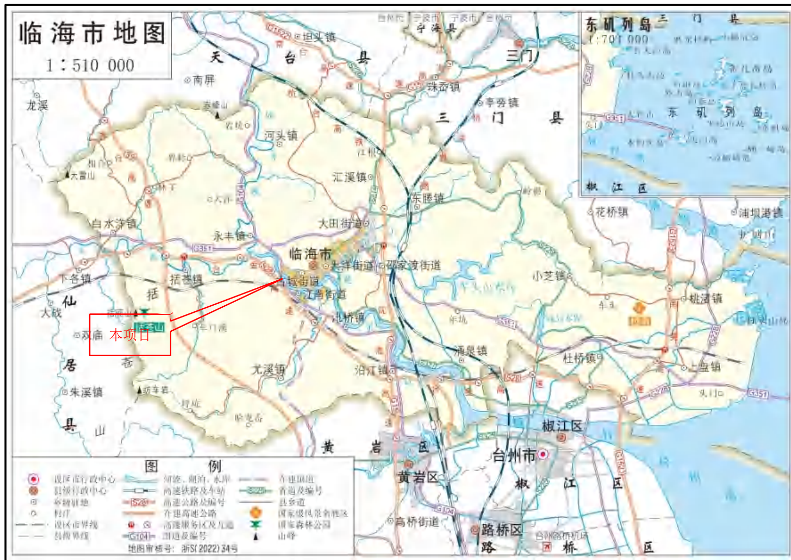
附图 1 项目地理位置图