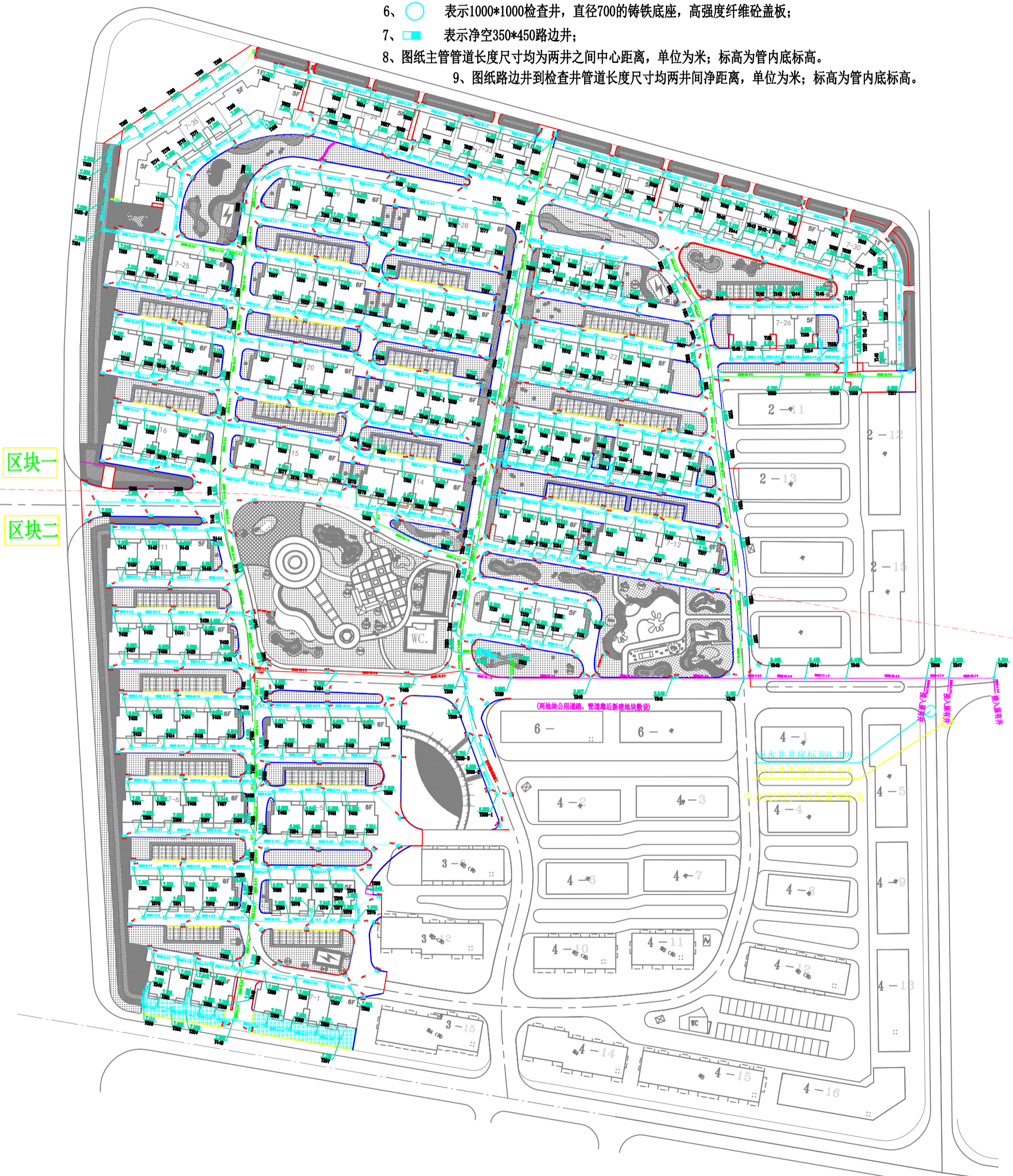
室外雨水管网平面图